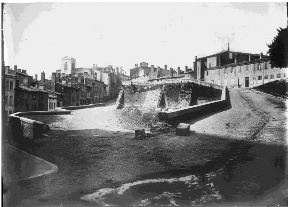
Vue du clocher tel qu'il était de la fin du XVIIIème siècle à 1912.