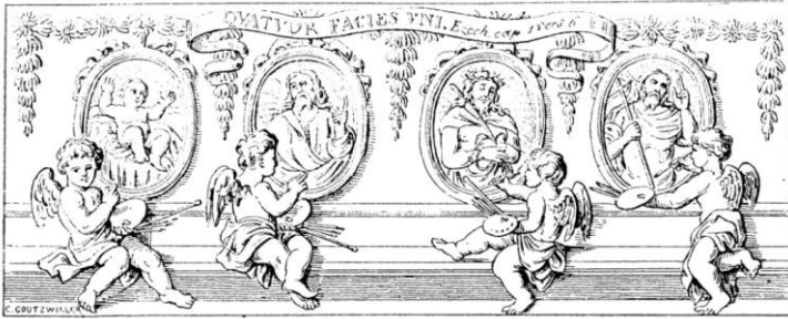
Les quatre états de la vie de Jésus-Christ : Vie cachée, vie agissante, vie souffrante et vie triomphante. — Hist. sainte du P. N. Talon. 1659.