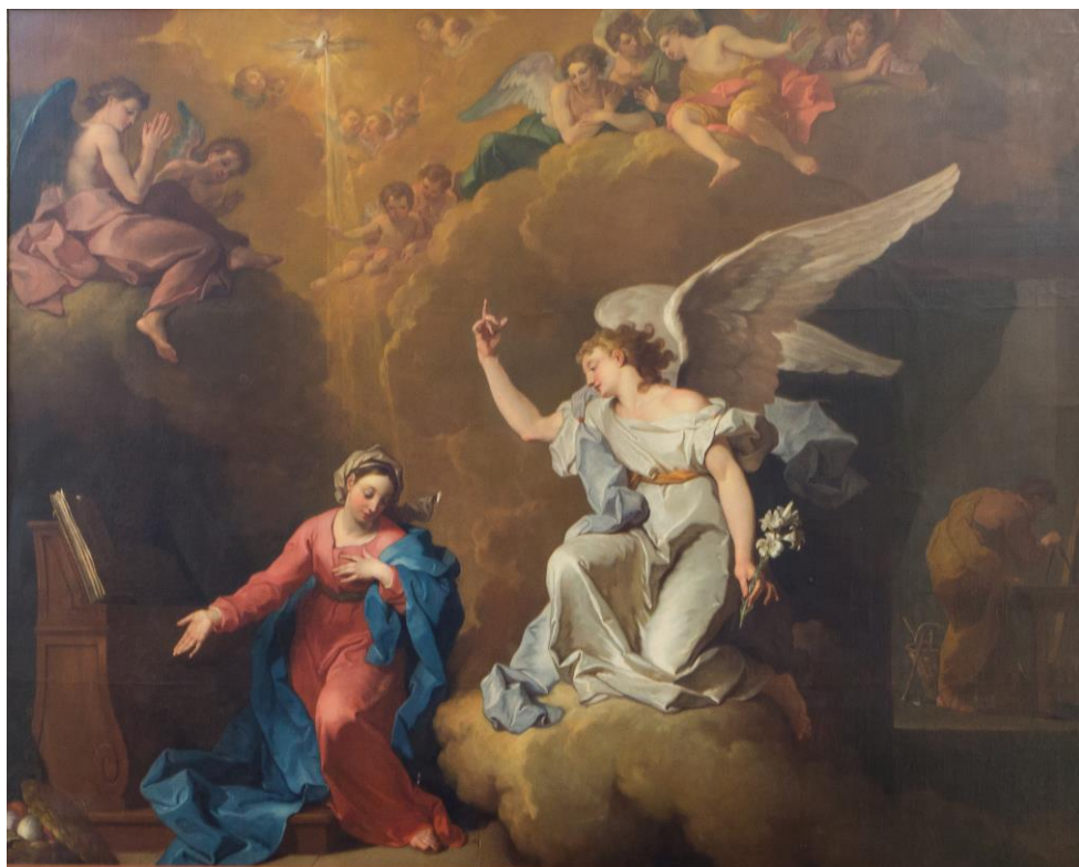
Annonciation de Collin de Vermont