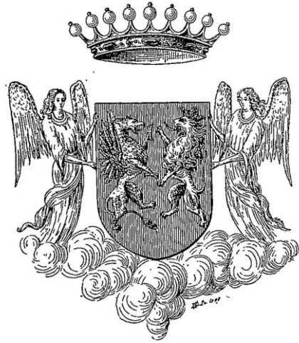
ARMES DU CHAPITRE DE LYON