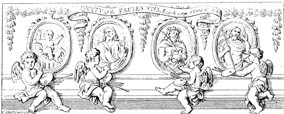
Les quatre états de la vie de Jésus-Christ :

L'Epiphanie étant la dernière fête du Temporal avant le cycle pascal, le Pontifical Romain (Pars III. De publicatione festorum mobilium in Epiphania Domini ) fait publier solennellement au jour de cette fête, dans les églises cathédrales, la date de Pâques et des principales fêtes mobiles de l'année. Cette publication, selon des usages locaux, peut également se faire dans les églises principales et les églises paroissiales.