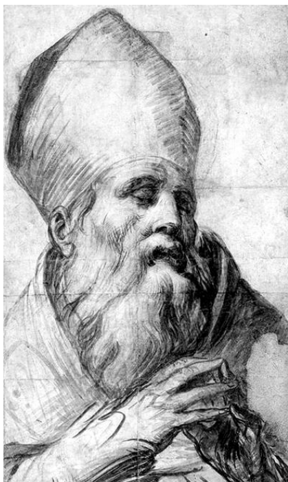
New York, Metropolitan Museum Dessin au fusain et pinceau avec encre brune

Ce dessin très vivant est l'œuvre de l'un des plus grands artistes italiens de ce qu'on a appelé le Maniérisme, et qui est en réalité la deuxième phase de la Renaissance. De son vrai nom Girolamo Francesco Maria Mazzola, également appelé en France le Parmesan, né en 1503 et mort en 1540 à Parme, il appartenait à une famille de peintres et ce sont ses oncles qui vont lui assurer sa première formation technique.