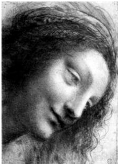
Léonard de Vinci, Etude pour une nativité, New York, Metropolitan Museum of Arts, sans date.

Nous l'avons déjà dit : l'art de la Renaissance, qui se développe dans des proportions impressionnantes (au point que l'on retient essentiellement de ces deux siècles d'histoire l'évolution des formes musicales, architecturales, picturales et plastiques), n'est pas exclusivement religieux. Pour autant, l'art chrétien reste au premier plan, principalement pour deux raisons :