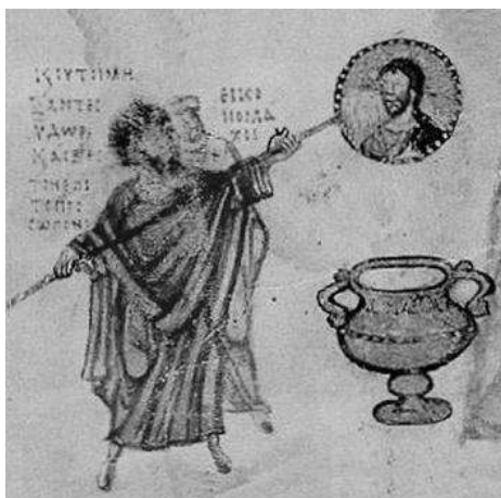
Profanation des saintes icônes au VIII ème siècle - peinture sur parchemin, Constantinople