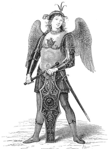
L'ARCHANGE SAINT MICHEL

Grand saint Michel, vous que Dieu a chargé d'introduire au ciel les âmes des élus, je vous prie pour tous ceux que j'ai aimés et qui ne sont plus.